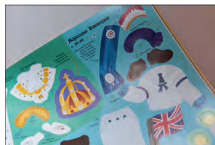
Inline formariccelt öntapadó