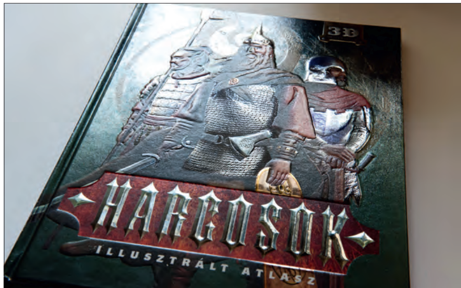
Domborozott, ezüsfóliázott és hibridlakkozott borító

termékek előállítását teszi lehetővé, amelyek tervezésénél még a nyugat-európai könyvkiadók is főleg távol-keleti előállításban gondolkodnak.