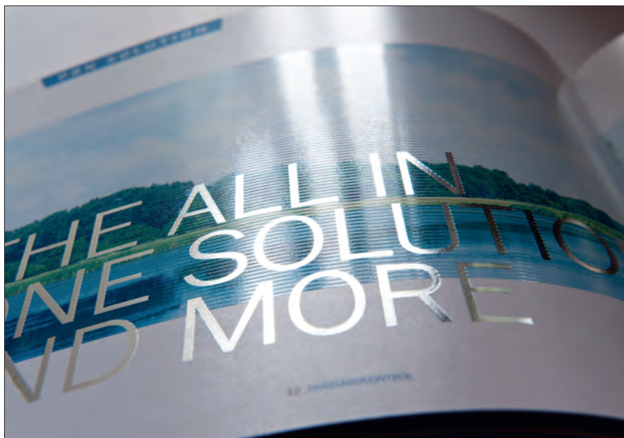
Hideg ezüsthólia (Cold foil) durva hibridlakkal