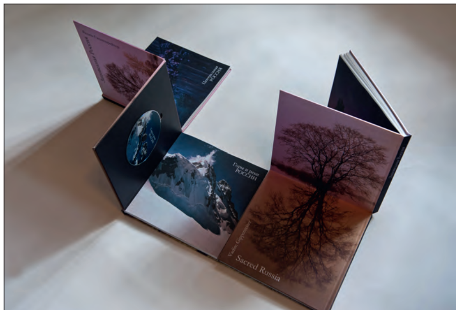
Többrészes keménytáblás album CD-tartókkal