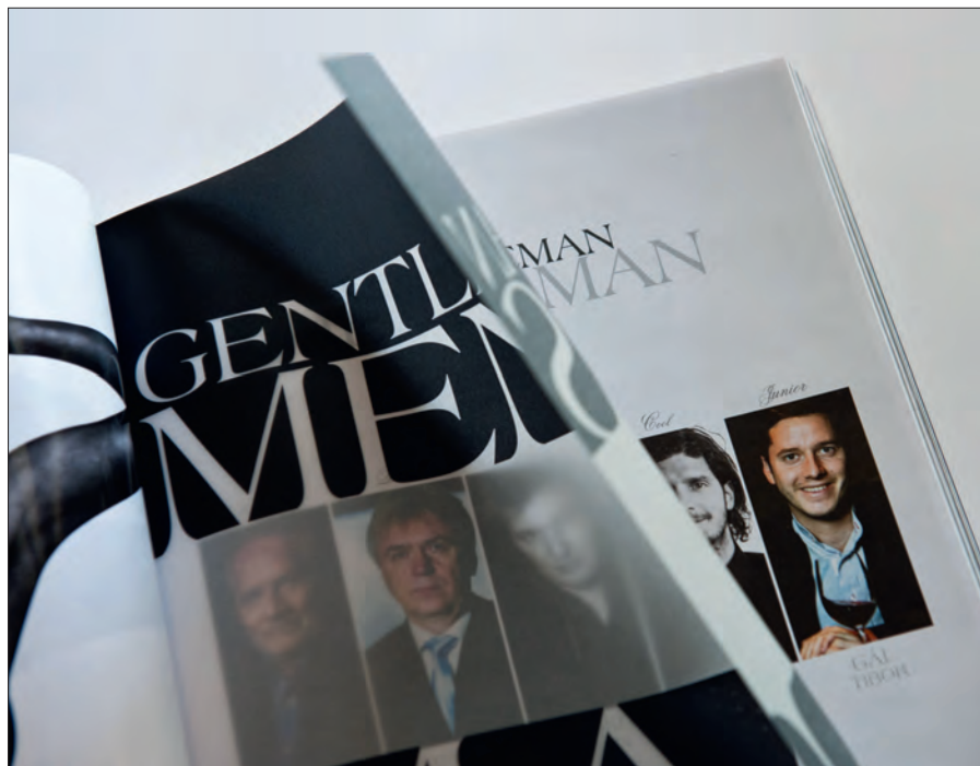
Exkluzív hatást keltenek a pauszpapírra készült nyomatok

– K.Á.: Ebből a szempontból segített a válság. A nagy nyugati kiadók egyre kevésbé akarják raktáraikban tárolt késztermékekben lekötni pénzeszközeiket. Ezenkívül az elmúlt években jelentősen megdrágult a kínai gyártás: azért ott is csak nőnek a bérek, a kőolaj világpiaci ára és a környezetvédelmi szempontok miatt pedig egyre drágább a szállítás. Természetesen a kínai